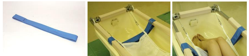
膝うらをベルトでリフトアップして滑り落ち防止