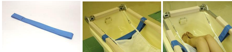
滑り落ち防止ベルト