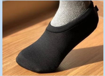
伸縮性に優れ、フィット感抜群