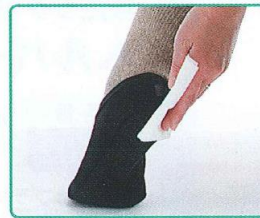
汚れもサッと一拭き、 衛生的です