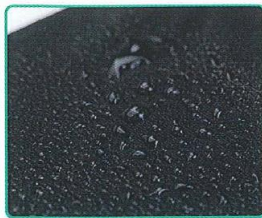
甲生地は撥水加工で 濡れにも安心!