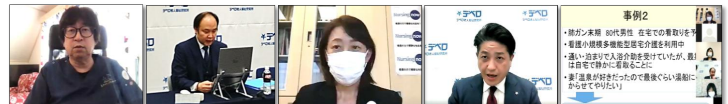
第57回全国入浴福祉研修会風景